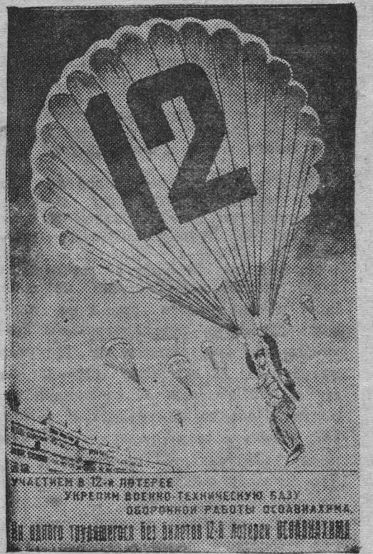
Для успешной реализации билетов 12-й лотереи Осоавиахима издательство Центрального Совета Осоавиахима выпустило агитационную литературу, красочные плакаты и листовки. На снимке: плакат работы художника А. Бельского, выпущенный к 12-й лотереи Осоавиахима.