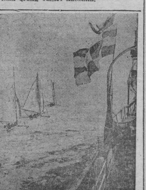
На снимке: Бура, встретившие вблизи Кринштата героическую четверку папанинцев.

На привокзальной площади и на улицах города героев-полярников встречали сотни тысяч киевлян.