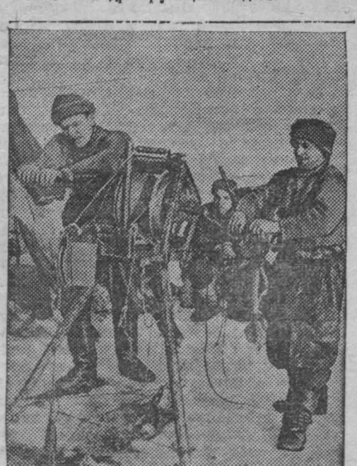
На снимке: Работа у гидрологической ледки на дрейфующей станции «Северный полюс». Слева направо — Э. Т. Кренкель и Герой Советского Союза И. Д. Папанин, сзади Е. К. Федоров. (Снято в августе 1937 г.)

Еще с утра город был украшен праздничному. Воздух красные флаги, портреты вождя партии и правительства, героев-полярников, лозунги, транспаранты с приветствиями победителям ледяных просторов Арктики. Большие плакаты изображают станцию «Северный полюс» на дрейфующей льдине.